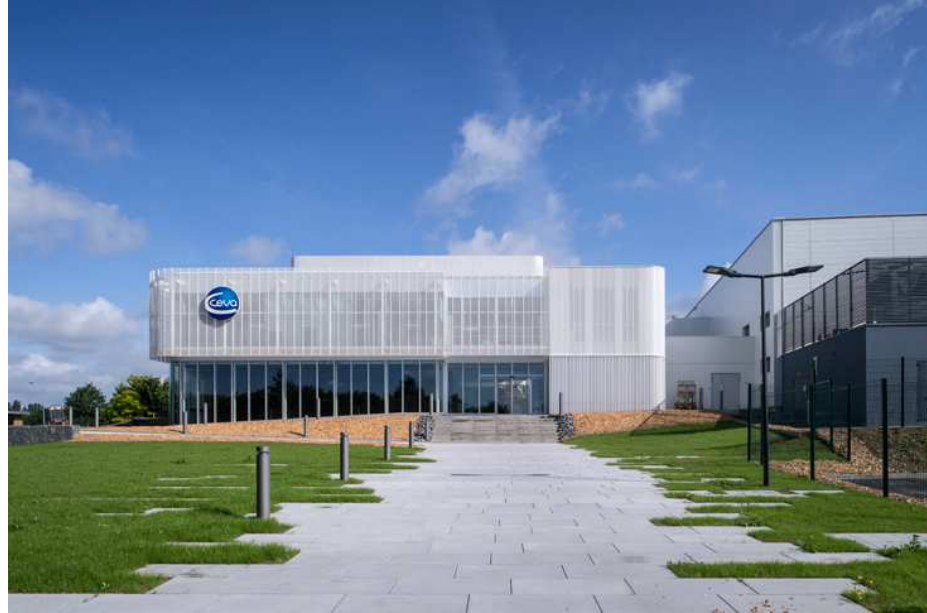
CEVA CAMPUS – CEVA SANTE ANIMALE – LAVAL (53)

ACTUALITÉS RÉALISATIONS CONCOURS PUBLICATIONS AGENCE CONTACT