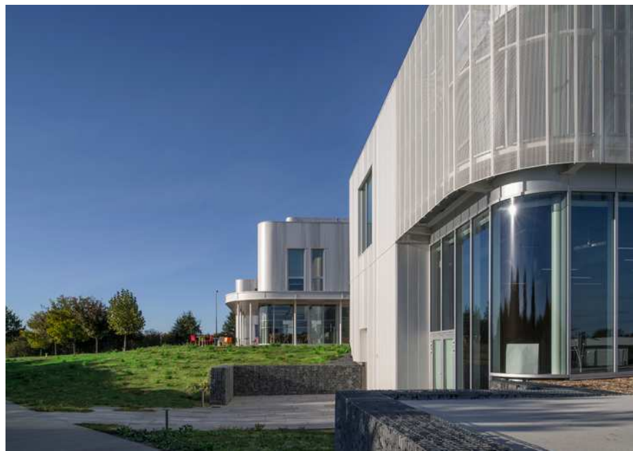
CEVA CAMPUS – CEVA SANTE ANIMALE – LAVAL (53)

Le projet a consisté à construire un bâtiment de bureaux et des laboratoires pour le compte de CEVA SANTÉ ANIMALE. CEVA a fixé des objectifs élevés en matière de qualité de vie au travail, en insufflant un esprit d'innovation sociale. Le Groupe intègre les espaces de travail dans ses méthodes de management, en développant le fonctionnement de projets collaboratifs.